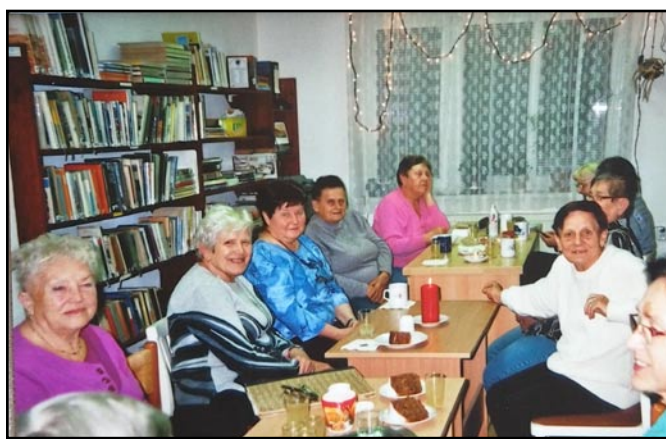
Členové zájmového sdružení Chrupa