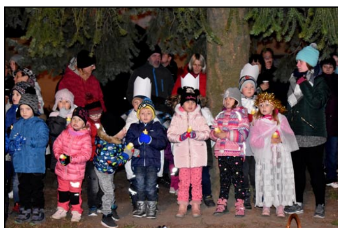
Rozsvícení vánočního stromu 1. 12. 2019. Program připravila mateřská škola.