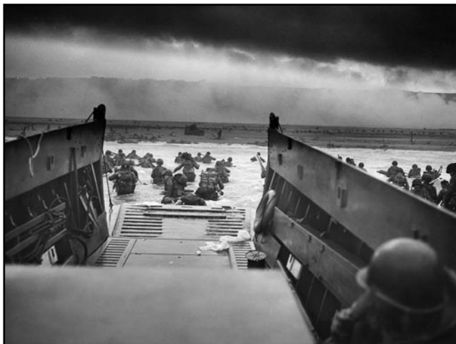
Den D a vylodění se 1. americké pěší divize na pláži Omaha v bitvě o Normandii. Autor snímku Robert F. Sargent ho příznačně nazval „Do spárů smrti“.

Po vylodění spojenců na Apeninský poloostrov u Salerna postupovala jejich vojska na sever a vytlačila silně se bránící německé síly na počátku zimy 1943 až ke Gustavově linii, nacházející se jižně od Říma. V téže době začala dlouhá a těžká bitva o Monte Casino, kde se vyznamenali hlavně Poláci. Do Říma vstoupila spojenecká armáda 4. června 1944. Při dalším postupu na sever Itálie byl ale německý odpor tak velký, že se ho Spojencům překonat do zimy 1944 nepodařilo.