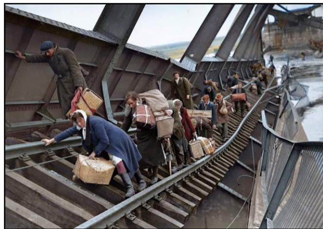
Němci prchají před Rudou armádou přes zničený most na Labi v r.1945