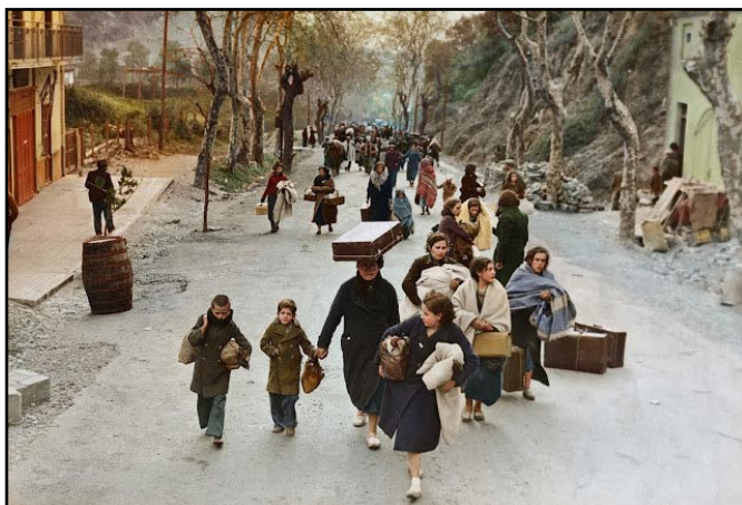
Uprchlíci opouštějí Paříž v roce 1940 před postupujícími Němci

Na státy Belgie, Lucemburska, Holandska a Francie se vojska Osy bez vyhlášení války vrhla 10. května 1940. Dne 28. května 1940 belgický rozhlas světu oznámil, že belgická armáda po osmnácti dnech těžkých bojů složila zbraně. Po vpádu Wehrmachtu do Lucemburska německé úřady prohlásily Lucemburčany za německé občany a 13 000 jich povolaly do německé armády. Po útoku nacistických vojsk na Holandsko a těžkém bombardování Rotterdamu Holandsko 14. 5. 1940 kapitulovalo – o 3 dny později se vzdalo město Brusel v Belgii. 10. června 1940 vstoupila do války po bok Německa fašistická Itálie . Paříž byla obsazena po obrovském vítězství Osy německými a italskými vojsky 14. 6. 1940.