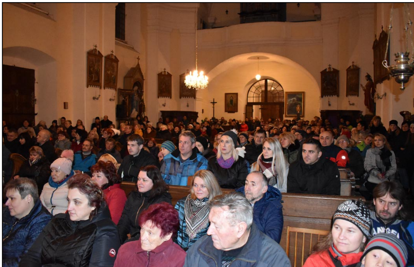
13. prosince 2019 vystoupila v kostele v Chroustovicích známá zpěvačka a herečka Yveta Blanarovičová .